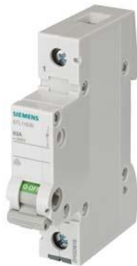
wyłącznik 100 A 1-biegunowy