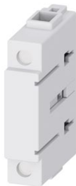
zacisk przelotowy N, Zabudowa frontowa, akcesorium do Rozłącznik izolacyjny 3LD3