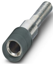
Listwa wtyków pomiarowych, liczba biegunów: 1, kolor: czarny

Dane zawarte w tym dokumencie PDF zostały wygenerowane z naszego katalogu online. Kompletne dane znajdują się w dokumentacji użytkownika. Obowiązują ogólne warunki użytkowania dla materiałów pobieranych.